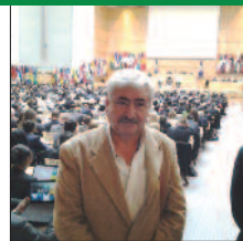
social y representación sindical. La normativa argentina impide que estos trabajadores se

con la batalla por la detección de situaciones laborales disfrazadas como cuentapropistas, y otras que, como el trabajo de venta directa, son directamente “invisibles”, como el trabajo de venta directa